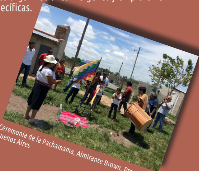
Ceremonia de la Pachamama, Almirante Brown, Provincia de Buenos Aires

Con el retorno de la democracia (en el año 1983) se va dando el surgimiento y consolidación de las diferentes organizaciones indígenas y empiezan a sancionarse legislaciones específicas.