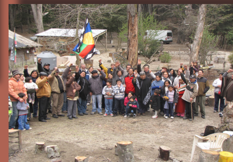
Movilización mapuche, comunidad Paichil Antriao, Villa la Angostura, provincia de Neuquén

Desde una concepción de respeto y aceptación de la diversidad cultural, reconoce la preexistencia de los pueblos indígenas a los Estados Nacionales, el derecho a la autodeterminación y a la posibilidad de elección en temas fundamentales como educación, salud, seguridad social, tierra y vivienda. Además, reivindica el derecho a la consulta en situaciones donde haya conflicto de intereses entre diferentes grupos acerca de sus territorios y los recursos naturales. La reforma constitucional del año 1994 le otorgó rango supralegal (en el artículo 75 inciso 22). 6