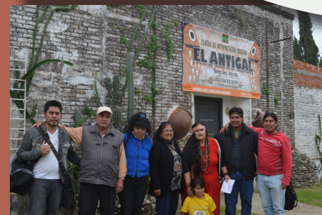
Dirigentes indígenas en el Centro de interpretación indígena "El Antigal", San Pedro, provincia de Buenos Aires

El convenio 169 de la OIT, actualmente es uno de los instrumentos jurídicos más importantes a nivel internacional con respecto a los derechos de los pueblos indígenas.