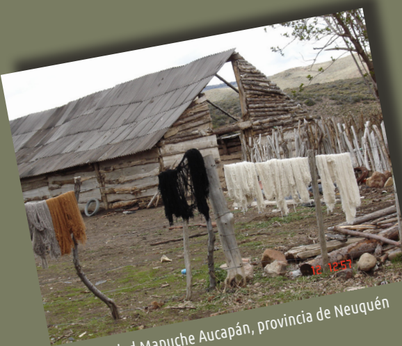
Comunidad Mapuche Aucapán, provincia de Neuquén

Las políticas que tienen como destinatarios a los pueblos indígenas son relativamente recientes ya que, históricamente el Estado ha asumido activamente (desde el Siglo XIX hasta bien entrado el Siglo XX) un rol beligerante primero y luego invisibilizador hacia estos grupos.