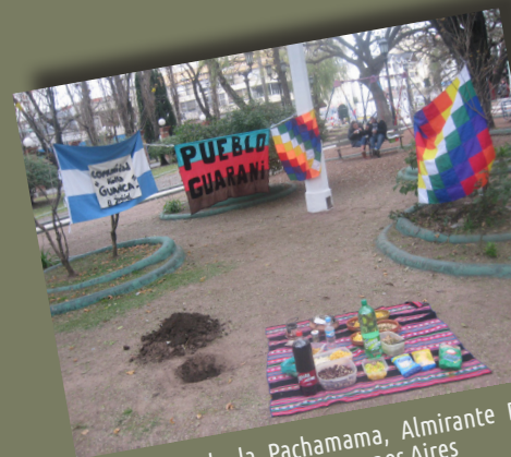
Ceremonia de la Pachamama, Almirante Brown, Provincia de Buenos Aires

Empieza el proceso por el cual se otorgan títulos de propiedad. Se realiza el primer censo indígena (publicado en 1968). 3