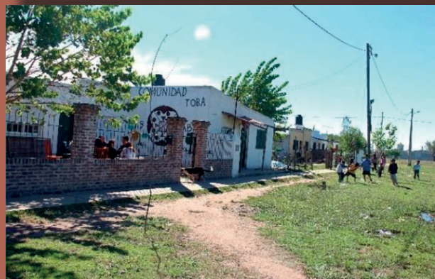
Comunidad Qom "19 de Abril", Marcos Paz, provincia de Buenos Aires

apoyo a las Comunidades Aborígenes". Dicha legislación dio origen al Instituto Nacional de Asuntos Indígenas (INAI) cuyo objetivo fue y sigue siendo unificar la cuestión indígena a nivel nacional contemplando la participación de dichos pueblos y la consulta previa frente a cualquier medida que pudiese afectarlos.