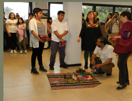
Encuentro de "voces y experiencias desde y hacia la interculturalidad", en la Universidad Nacional de Luján, San Miguel (Octubre 2016). En la foto se observa ceremonia indígena por parte de organizaciones indígenas de México.