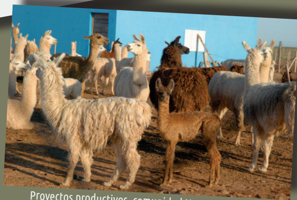
Proyectos productivos, comunidad Huarpe San Luis

Desde 1944 el Estado toma medidas que inciden directamente en la situación de las comunidades indígenas: proclama el Estatuto del peón –primera norma legislativa que regula las condiciones de vida y laborales de los trabajadores rurales– 1 y la Argentina se incorpora como miembro del Instituto Indigenista Interamericano, organismo de la OEA. 2