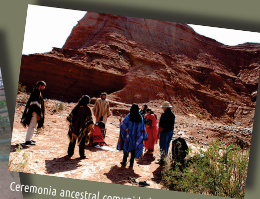
Ceremonia ancestral comunidad Huarpe en Quijadas, provincia de San Luis